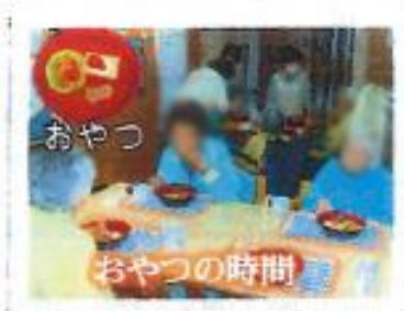
おやつ おやつ時間