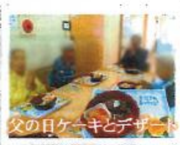
父の日ケーキとデザート