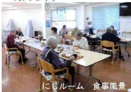
にじルーム 食事風景

フロアを「にじルーム」と「ゆめルーム」の二カ所に分けて、密を避け、ゆったりとお過ごしいただいております。