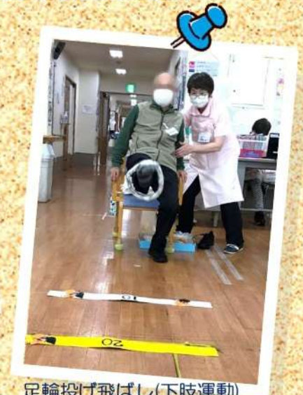
足輪投げ飛ばし(下肢運動)

消毒、マスク着用、ソーシャル ディスタンス、窓をあけての換 気を徹底して行っています。