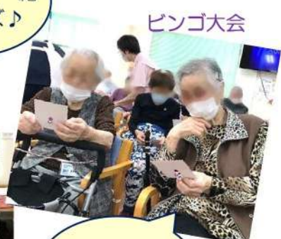
ビンゴにな ったかな？