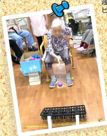
はすんでポン! (上肢運動)