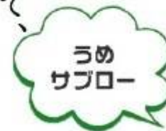
メインキャラクター 健康志向の元気な男の子。