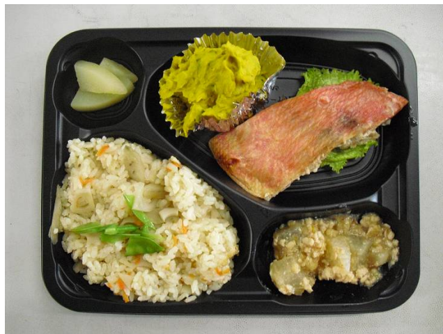
(例) 昼食 お弁当