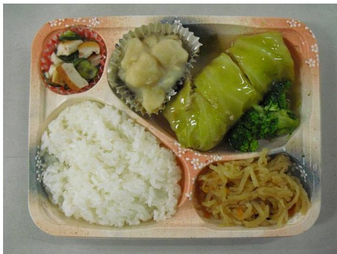
(例) 夕食 お弁当